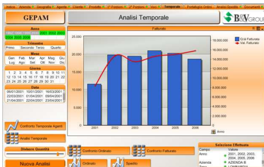
INDICE DI ANALISI DEL FATTURATO SU BASE TEMPORALE