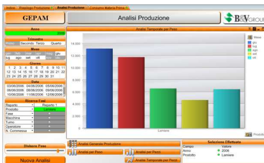
ANALISI GRAFICA DELLA PRODUZIONE SU BASE MENSILE